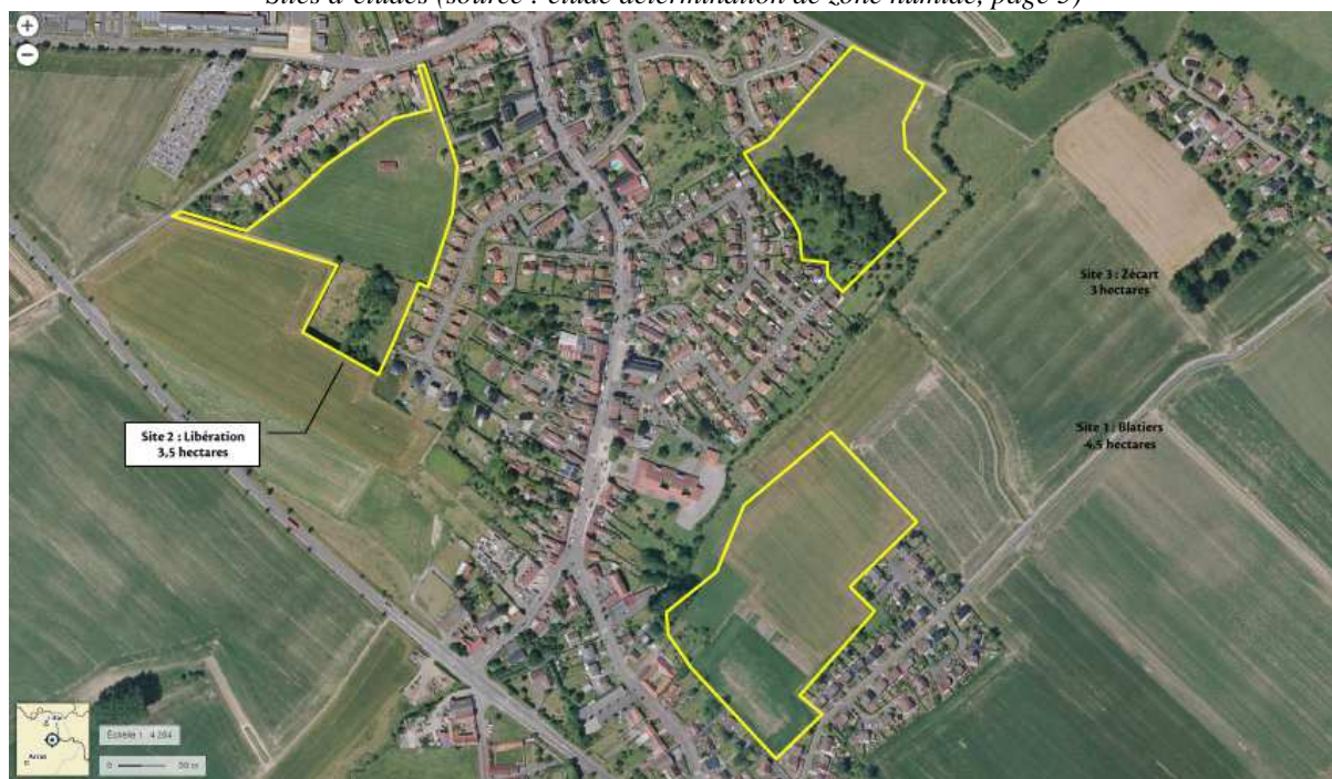
Sites d'études

L'ensemble des sondages ont permis d'identifier une zone humide de 2,1 hectares sur le site « Zécart » et deux zones humides de 1170 m 2 et 3542 m 2 sur le site « Blatiers ».